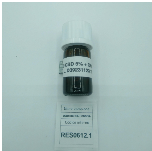
CAMPIONE ANALIZZATO: OLIO CBD 5% + CBG 5%(5.00gr)